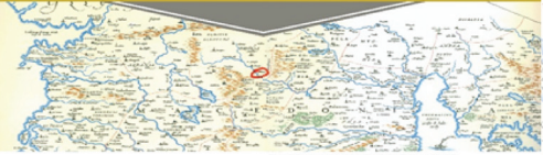
Χάρτης 1. Φλώρινα στο 2. Λαογραφικό Μουσείο Φλώρινας (1888 - 1942)

“ΦΛΩΡΙΝΙΩΤΕΣ ΑΓΩΓΙΣΤΕΣ ΟΔΕΥΟΝΤΑΣ ΠΡΟΣ ΤΗ ΔΟΞΑ”.